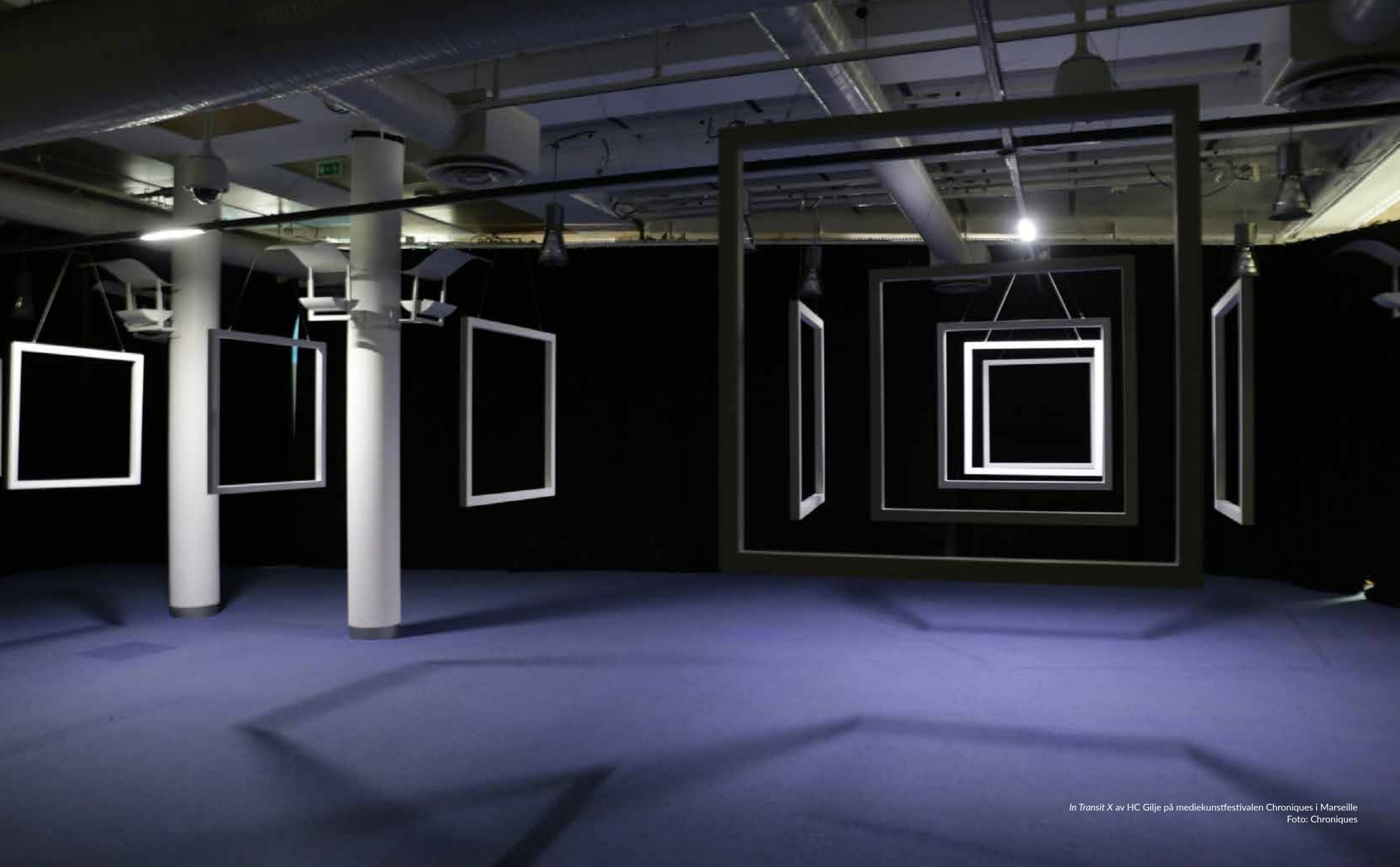
In Transit X av HC Gilje på mediekunsthifestivalen Chroniques i Marseille