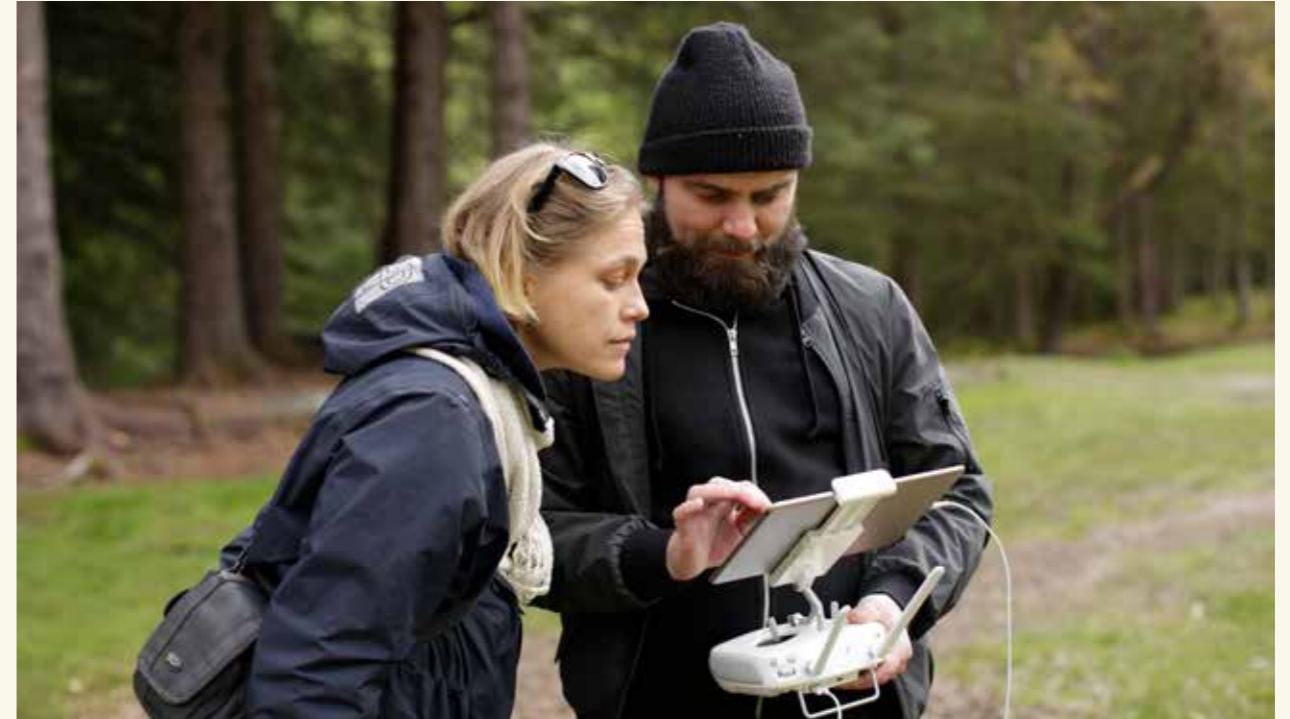
Fra LAB'en From Macro to Micro and Back