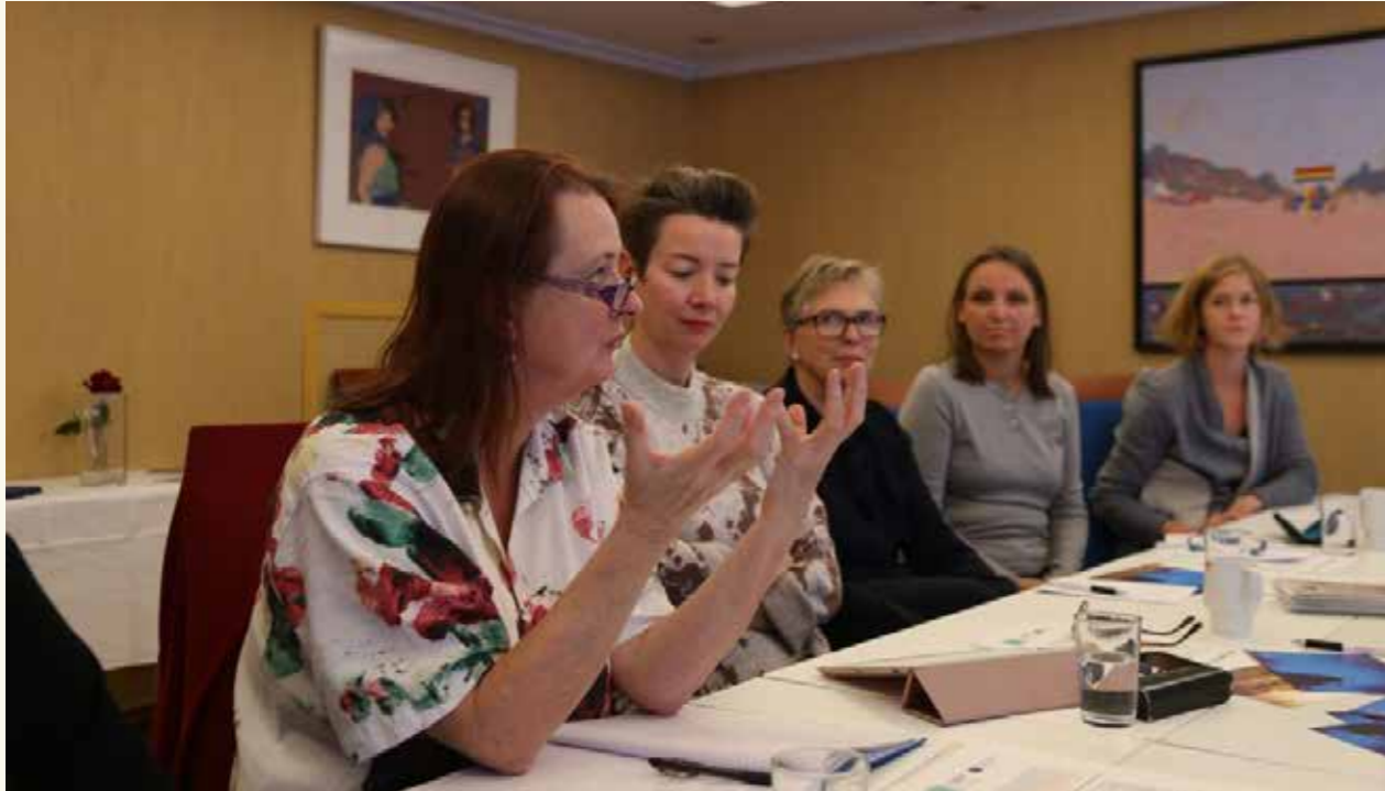
Fra Tenke- og deletank