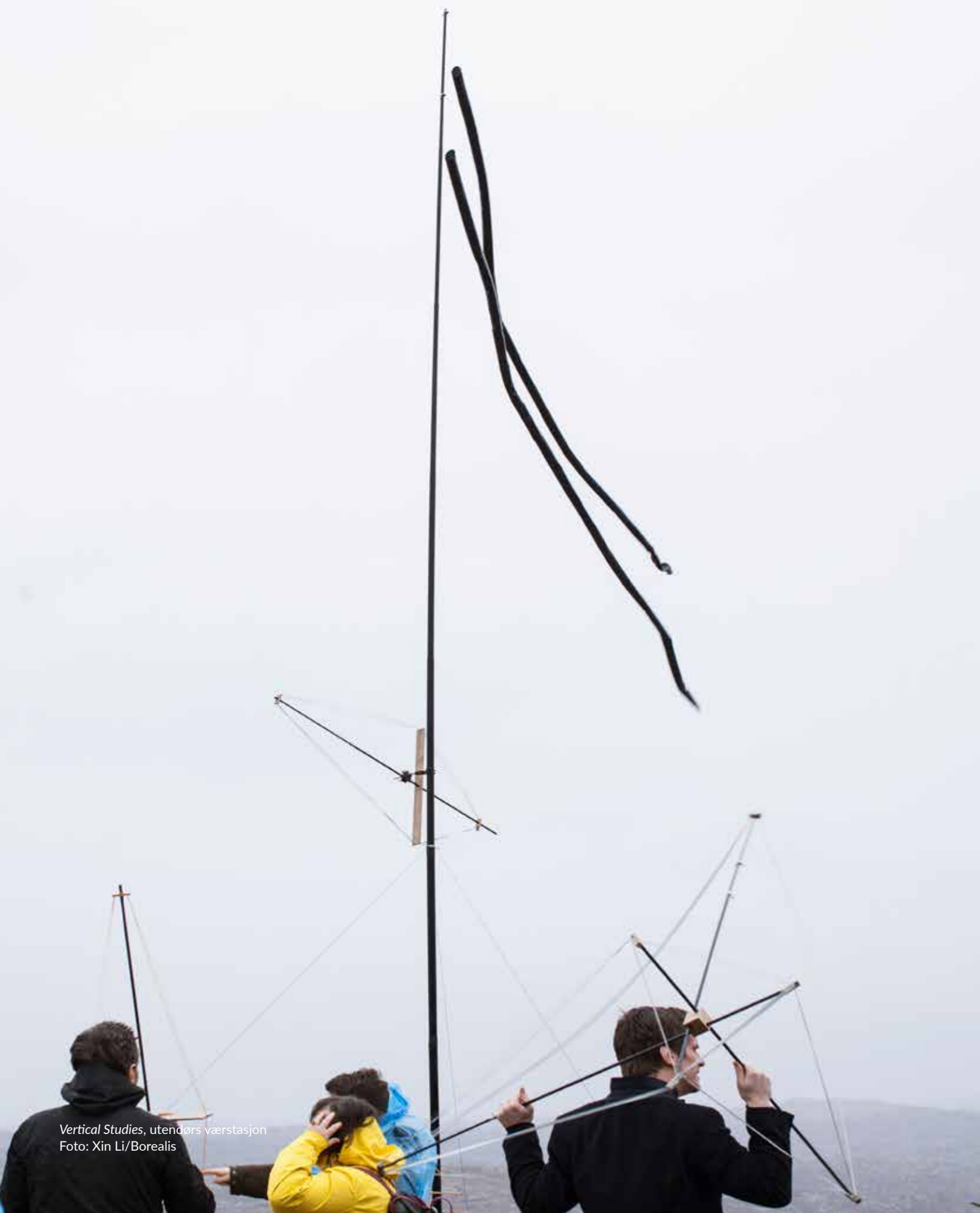
Vertical Studies, utendørs værstasjon