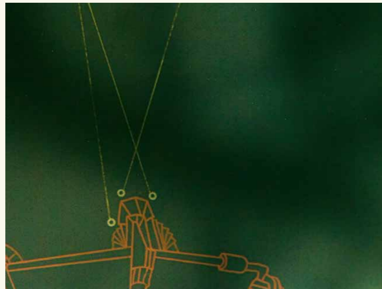
Fra animasjon av Line Hvoslef for verket Wings of Chains

Konsertforestilling på Festspillene i Bergen hvor plastavfall ble omgjort til nye instrumenter