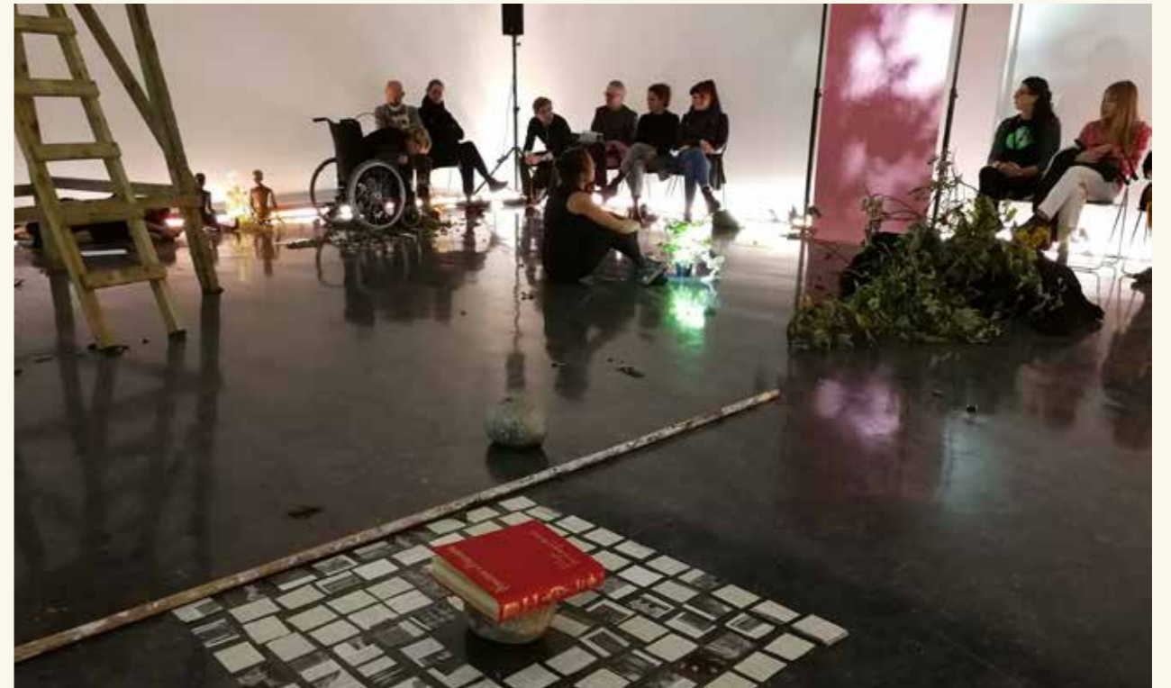
Fra forestillingen Blind Spot på Bergen Kunsthall