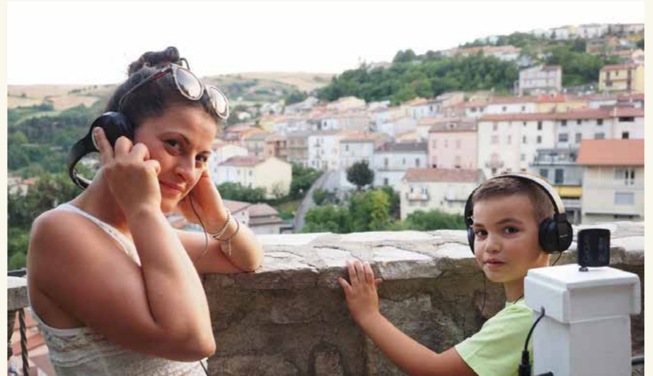
Fra residency for lydkunstnere i Fortore, Italia

Todagers workshop for å komme i gang med 3D-modelleringsprogramvaren Sketchup med Jan Willem Hagenbeek. Sketchup brukes til å tegne opp rom for å plassere installasjoner og utstyr, og er spesielt nyttig når det kommer til å skissere eksempelvis gallerier, teatre og konsertsteder.