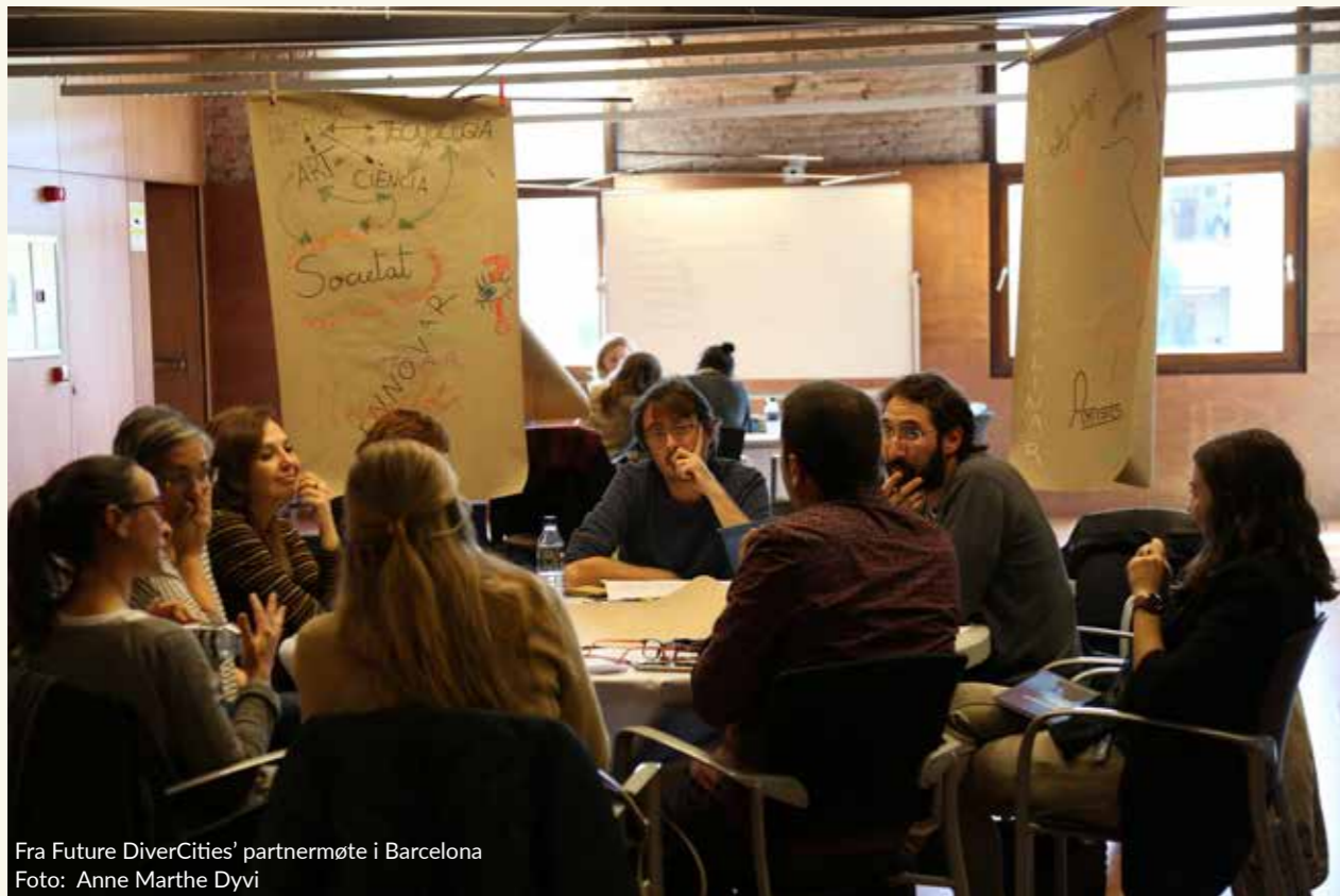
Fra Future DiverCities' partnernemøte i Barcelona