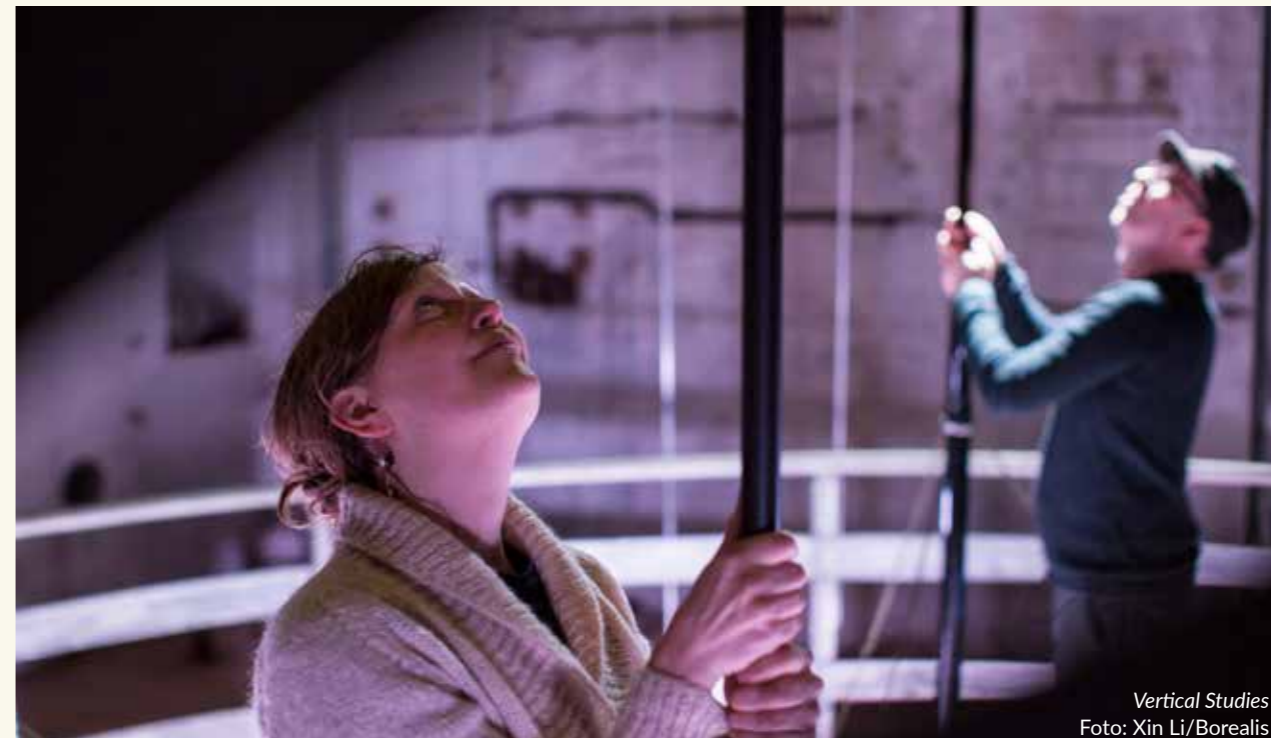
Vertical Studies